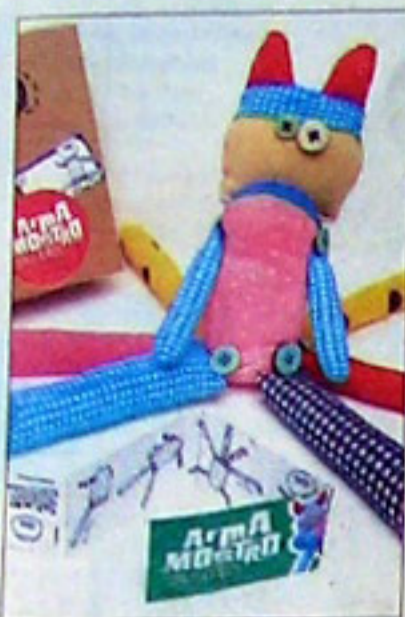
Presillas y botones cambian la anatomía del Armamostro (68 pesos, Sopa de príncipe)