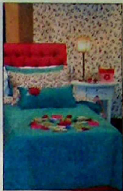
Para ellas, rosa viejo y verde oxidado en el cubredredón y la pared (148 pesos, Serena Tais)