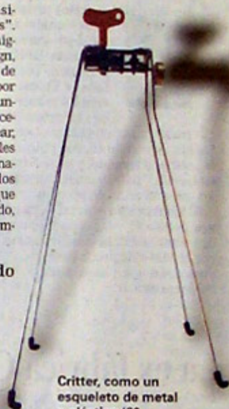
Critter, como un esqueleto de metal y plástico (60 pesos, Bicalho, en Tiendamalba)