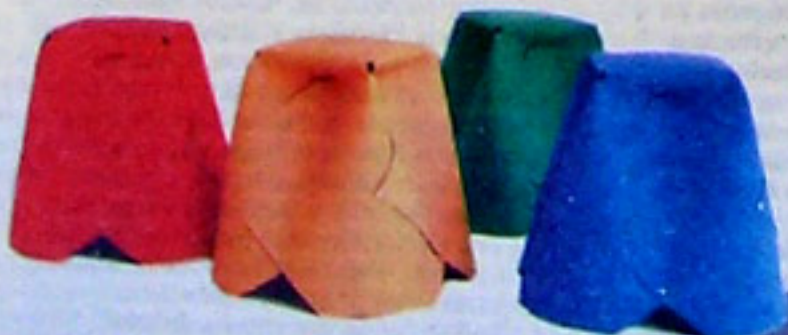
A partir del pliegue de una placa de cartón surge el banco apilable Circus Tool (147 pesos, A. Sarmiento en Tiendamalba)