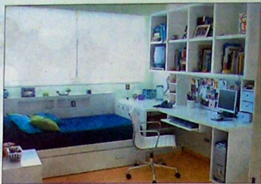
Pensada para chicos activos y con materiales nobles laqueados, esta habitación contiene biblioteca, un escritorio (ambos, 2900 pesos) y cubos guardaobjetos optimizando el espacio (IKB Design)