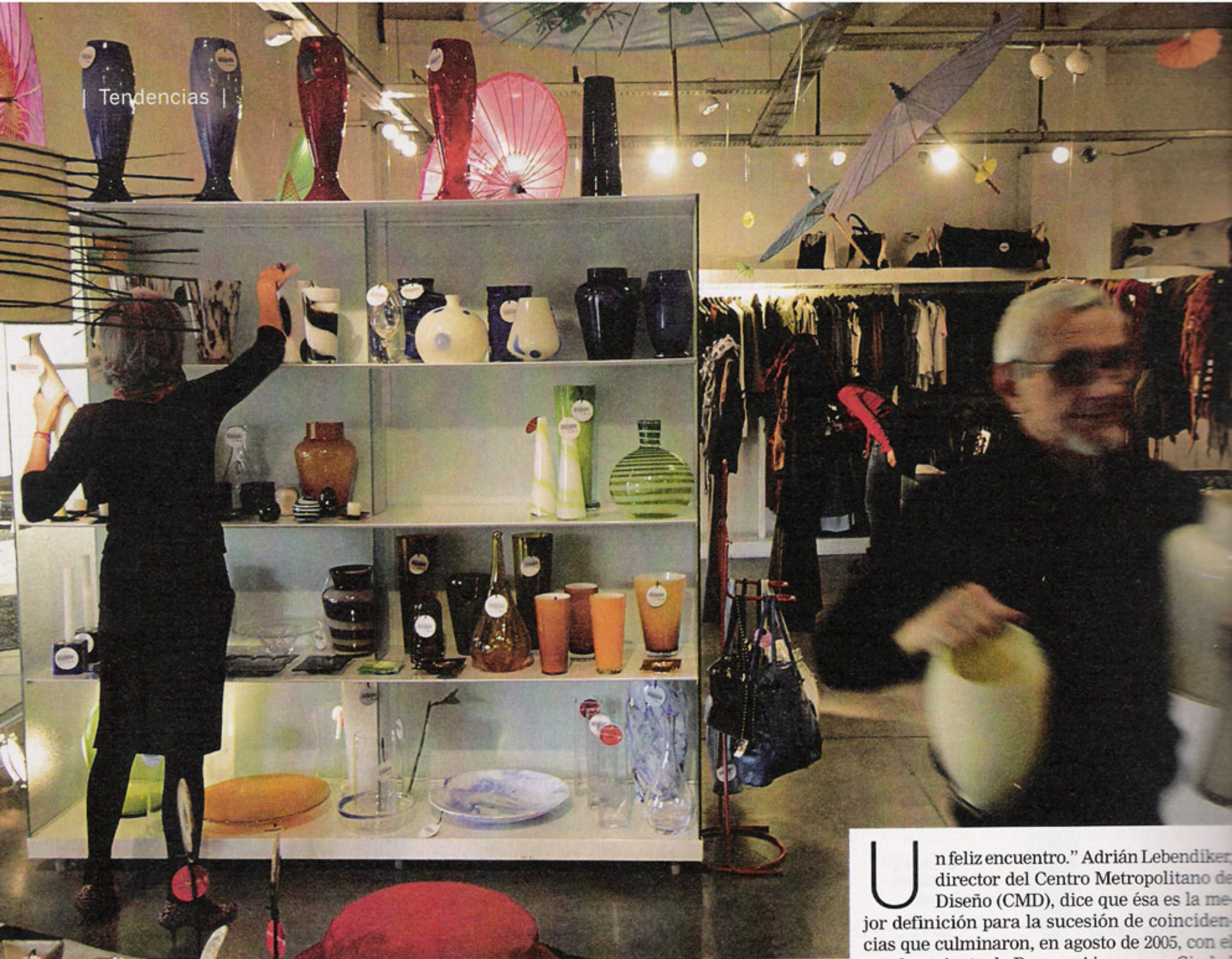
Tienda Puro Diseño, uno de los tantos espacios que fomentan el consumo del diseño de autor